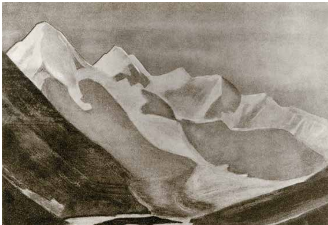
Н.К. Рерих. БЕЛУХА. 1926. Местонахождение неизвестно

В настоящее время одна из «Белух» обнаружилась в частном собрании в Москве. Работа выполнена темперой на бумаге, наклеенной на картон, уточнённый размер составляет 23 × 29,5 см. Гора Белуха написана в преобладающих синих тонах. Художник создаёт единое с землёй небесное пространство, заполненное возвышающимися округлёнными склонами гор. Массив Белухи и её две вершины с «седлом» посередине расцвечены охрой, чтобы подчеркнуть краски солнечного звенящего дня. Именно об этом и писал Рерих в своих путевых заметках. Небольшой этюд выполнен с натуры, с дальнего расстояния, с той самой окраины долины, откуда путешественники видели Белуху. Потому соотношение дальних гор и ближнего плана с синими громадами вполне соответствует художественной композиции. По нижнему краю этюда кириллицей печатными буквами написано слово «Белуха». Вполне