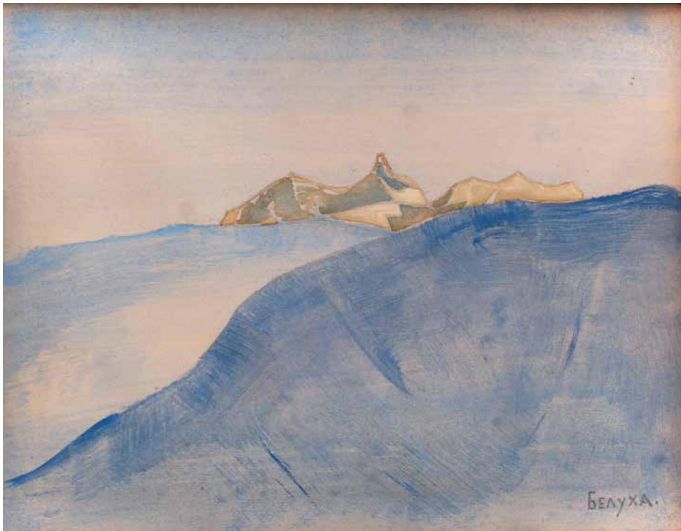
Н.К. Рерих. БЕЛУХА. Этюд. 1926. Частное собрание, Москва

записи видно, какое большое значение придавалось отмеченному событию. Именно ясным днём 17 августа 1926 года Рерихи видели Белуху из долины. Это произошло накануне отъезда из Горного Алтая в обратный путь. Точка наблюдения могла находиться в одном из ближайших мест, из которых видна Белуха, недалеко от переправы через Катунь, на южных склонах Теректинского хребта. Другие наиболее удобные места, откуда гора видна во всём своём великолепии, например алтайское село Тюнгур, находились от базы экспедиции (Верх-Уймон) на значительном удалении, и Белуха оттуда открывается в ином ракурсе. Поездка на лошадях на расстояние до ста километров туда и обратно потребовала бы больших физических усилий перед самым отъездом.