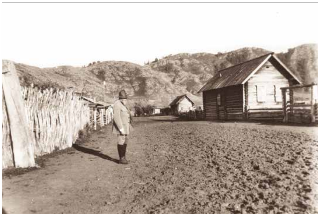
Н.К. Рерих в селе Верх-Уймон. 1926. Фото, частное собрание, Москва

Этюды из нью-йоркского каталога с одним и тем же названием «Белуха» созданы в период пребывания экспедиции на Алтае. Тема, связанная с Алтаем, в частности с Белухой, крайне притягательна для интересующихся творчеством Н.К. Рериха, поскольку является нервом не только художественных, но и мировоззренческих поисков мастера. По мнению исследователей, она имеет прямое отношение к сюжетным полотнам, на которых присутствуют изображения священной горы. Это, например, «Ойрот — вестник Белого Бурхана» (1925), «Сосуд нерасплёсканный» (1927), «Святой Сергей» (1932), «Звенигород» (1933), «Победа» (1942). Некоторые исследователи полагают, что в целом можно насчитать более десятка таких произведений. Белуха выступает на картинах символом великого будущего. Всё то, что относится к этой теме, представляется важным культурным феноменом для наших современников и потомков.